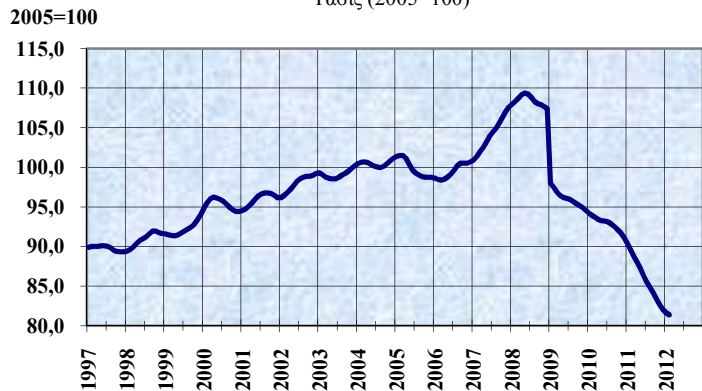
ΔΕΙΚΤΗΣ ΟΓΚΟΥ ΜΕΤΑΠΟΙΗΤΙΚΗΣ ΠΑΡΑΓΩΓΗΣ Τάσις (2005=100)