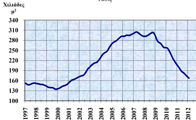
ΑΔΕΙΕΣ ΟΙΚΟΔΟΜΗΣ Τάσις