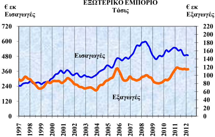
ΕΞΩΤΕΡΙΚΟ ΕΜΠΟΡΙΟ Τάσις