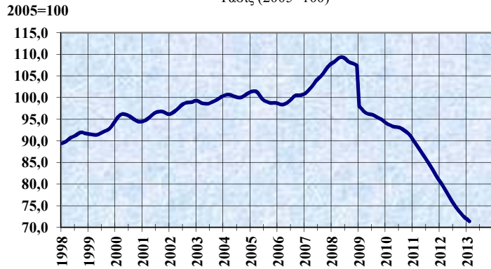
ΔΕΙΚΤΗΣ ΟΓΚΟΥ ΜΕΤΑΠΟΙΗΤΙΚΗΣ ΠΑΡΑΓΩΓΗΣ Τάσις (2005=100)