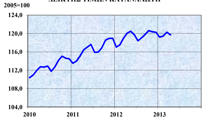
ΔΕΙΚΤΗΣ ΤΙΜΩΝ ΚΑΤΑΝΑΛΩΤΗ