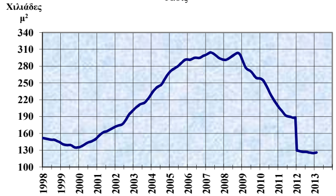
ΑΔΕΙΕΣ ΟΙΚΟΔΟΜΗΣ Τάσις