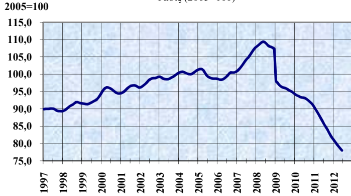
ΔΕΙΚΤΗΣ ΟΓΚΟΥ ΜΕΤΑΠΟΙΗΤΙΚΗΣ ΠΑΡΑΓΩΓΗΣ Τάσις (2005=100)