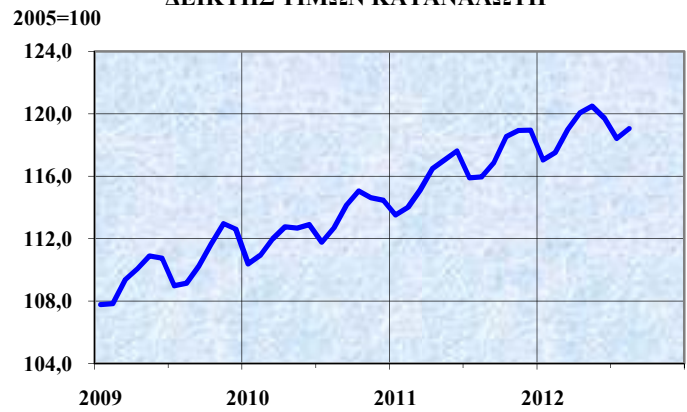
ΔΕΙΚΤΗΣ ΤΙΜΩΝ ΚΑΤΑΝΑΛΩΤΗ