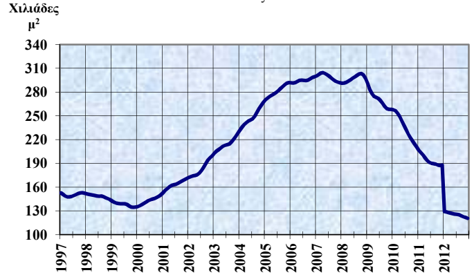
ΑΔΕΙΕΣ ΟΙΚΟΔΟΜΗΣ Τάσις