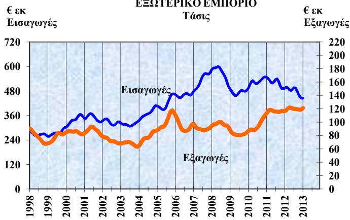
ΕΞΩΤΕΡΙΚΟ ΕΜΠΟΡΙΟ Τάσις