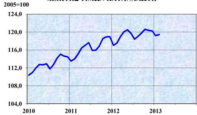
ΔΕΙΚΤΗΣ ΤΙΜΩΝ ΚΑΤΑΝΑΛΩΤΗ