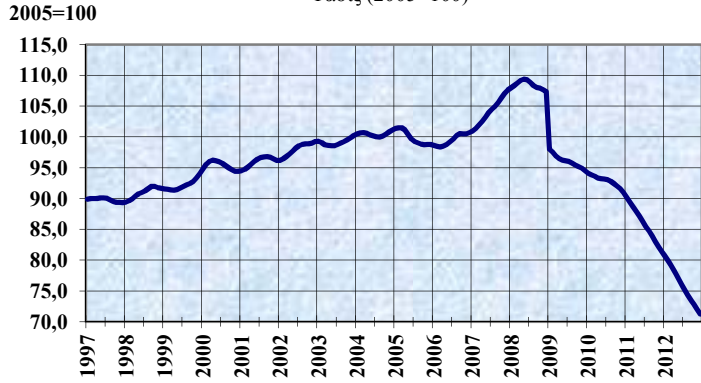
ΔΕΙΚΤΗΣ ΟΓΚΟΥ ΜΕΤΑΠΟΙΗΤΙΚΗΣ ΠΑΡΑΓΩΓΗΣ Τάσις (2005=100)