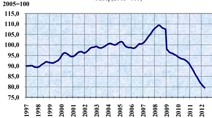
ΔΕΙΚΤΗΣ ΟΓΚΟΥ ΜΕΤΑΠΟΙΗΤΙΚΗΣ ΠΑΡΑΓΩΓΗΣ Τάσις (2005=100)