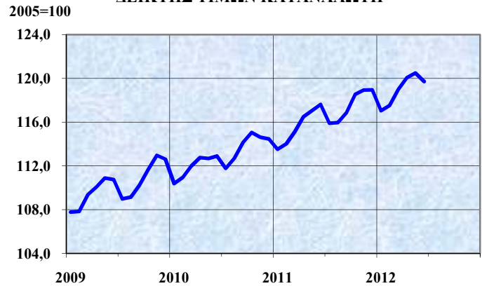
ΔΕΙΚΤΗΣ ΤΙΜΩΝ ΚΑΤΑΝΑΛΩΤΗ