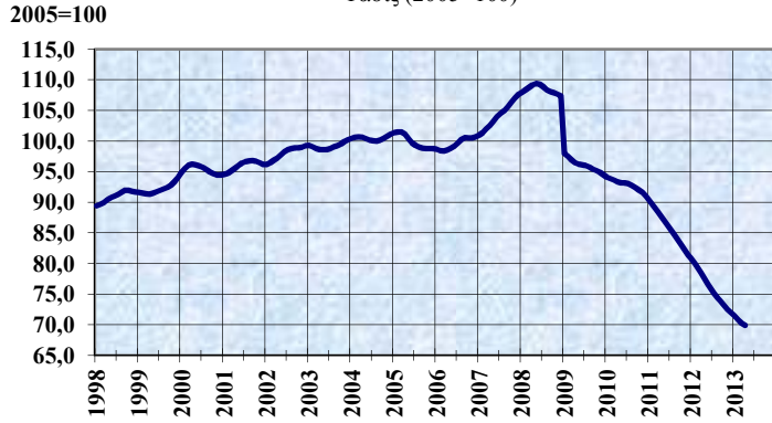
ΔΕΙΚΤΗΣ ΟΓΚΟΥ ΜΕΤΑΠΟΙΗΤΙΚΗΣ ΠΑΡΑΓΩΓΗΣ Τάσις (2005=100)