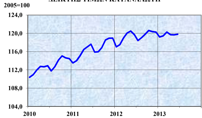
ΔΕΙΚΤΗΣ ΤΙΜΩΝ ΚΑΤΑΝΑΛΩΤΗ