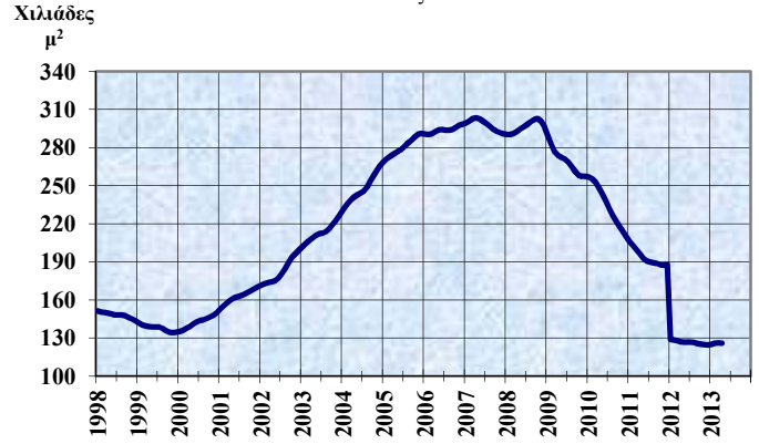
ΑΔΕΙΕΣ ΟΙΚΟΔΟΜΗΣ Τάσις